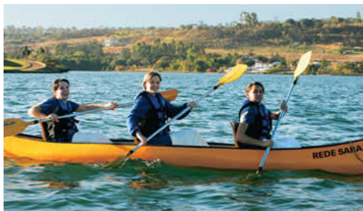
DIVERSÃO Pacientes da Rede Sarah praticam remo para melhorar a disposição

A partir de informações como essas, os cientistas resolveram identificar o que levava a esse impacto. Chegaram basicamente a duas razões. Uma é de natureza comportamental. Em geral, quem é otimista, tem esperança e cultiva alguma fé costuma ter hábitos mais