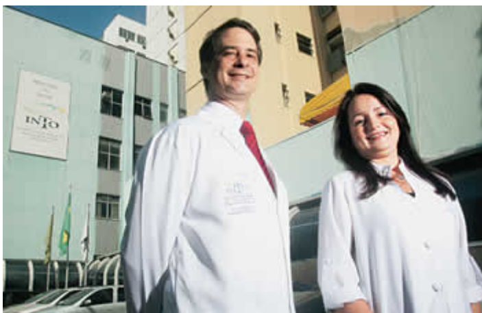
FORÇA Tito e Fátima incentivam postura positiva

ADRIANA PRADO E GREICE RODRIGUES Colaborou Cilene Pereira